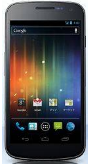
SUMSUNG Galaxy NEXUS

私も遅ればせながらスマートフォンを購入しデビューしました。 モバイル用ノートパソコンを持ち歩くので必要性が感じられませんでした。新規業務の立上げ で必要に迫られてスマートフォンを購入しました。 Android4.0 搭載のSAMSUNG の Galaxy NEXUS です。 画面サイズが大きいやつです。胸のポケットに入れると少し大き過ぎたかなと感じます。