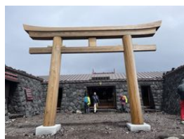
富士山頂浅間神社