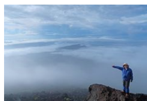
八合目からの雲海